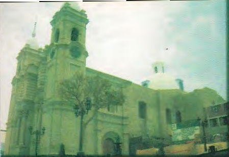
Templo de Santo domingo

Hoy sede de la Parroquia Santa Catalina y Catedral de Moquegua, su presencia se encuentra ya en 1653. Se inició como hospedería bajo la advocación de la Virgen del Rosario. Fue gravemente afectado por el terremoto del 2001 y reinagurada en abril del 2005. En su interior se encuentra la Viren y Mártir Santa Fortunata.